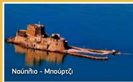
Ναύπλιο - Μπούρτζι