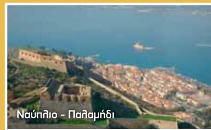
Ναύπλιο - Παλαμίδι