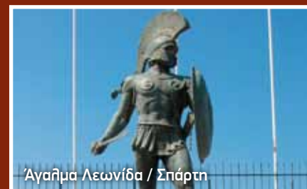
Άγαλμα Λεωνίδα / Σπάρτη

Από την Αλωνίσταινα ακολουθούμε τη διαδρομή προς την πρωτεύουσα της Αρκαδίας, την Τρίπολη. Η Τρίπολη είναι μια ολοζώντανη πόλη, με σπουδαία εμπορική και παραγωγική ιστορία, είναι ταυτόχρονα μια πόλη φιλόξενη, ζεστή, με ανθρώπινους ρυθμούς και μοναδικό χρώμα. Το Αρχαιολογικό Μουσείο και το Πολεμικό διηγούνται την ιστορία της πόλης και της ευρύτερης περιοχής. Σε λιγότερο από μια ώρα διαδρομής και προχωρώντας προς το νότο της Πελοποννήσου φτάνουμε στο Μυστρά.